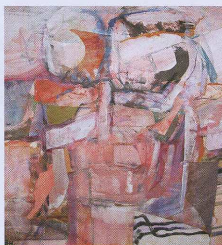
Lars Forsells porträtt är lysande och borde hänga på museum.