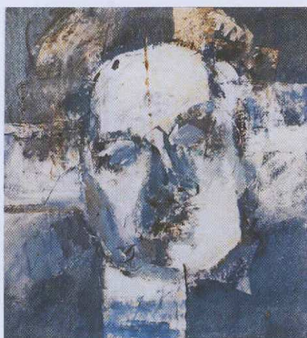
Edith Södergrans porträtt är så sönderbrutet att hon knapt känns igen.